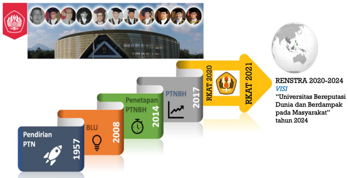
Gambar 1 Transformasi Tata Kelola Universitas Padjadjaran

Universitas Padjadjaran (Unpad) didirikan pada tanggal 11 September 1957 berdasarkan Peraturan Pemerintah (PP) Nomor 37 Tahun 1957. Pendiriannya merupakan jawaban atas prakarsa para pemuka masyarakat Jawa Barat yang mengharapkan keberadaan suatu institusi pendidikan tinggi yang memungkinkan generasi muda Jawa Barat mempersiapkan diri menjadi generasi terpelajar di masa depan. Unpad telah menjadi harapan masyarakat Jawa Barat, bangsa Indonesia, dan masyarakat dunia dengan menghasilkan para cendekiawan dan profesional sebagai agen utama penggerak pembangunan. Pada saat ini, Unpad diharapkan menjadi salah satu perguruan tinggi Indonesia yang memiliki karakter sebagai universitas bereputasi dunia.