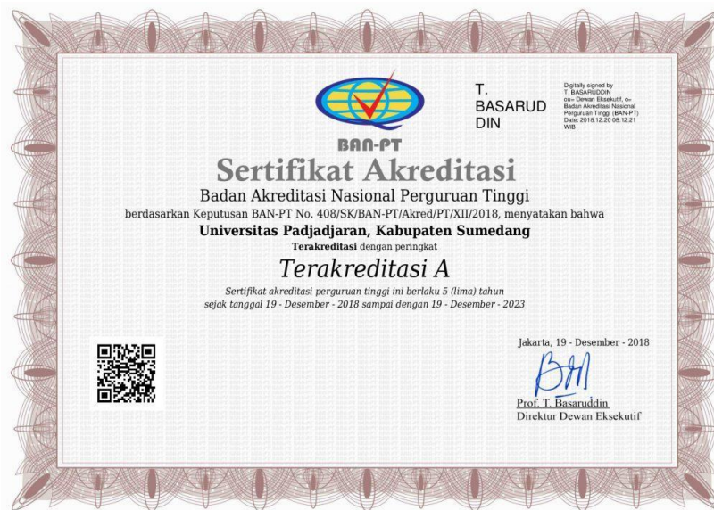
Gambar 3 Sertifikat Akreditasi Unpad dari BAN-PT Tahun 2018