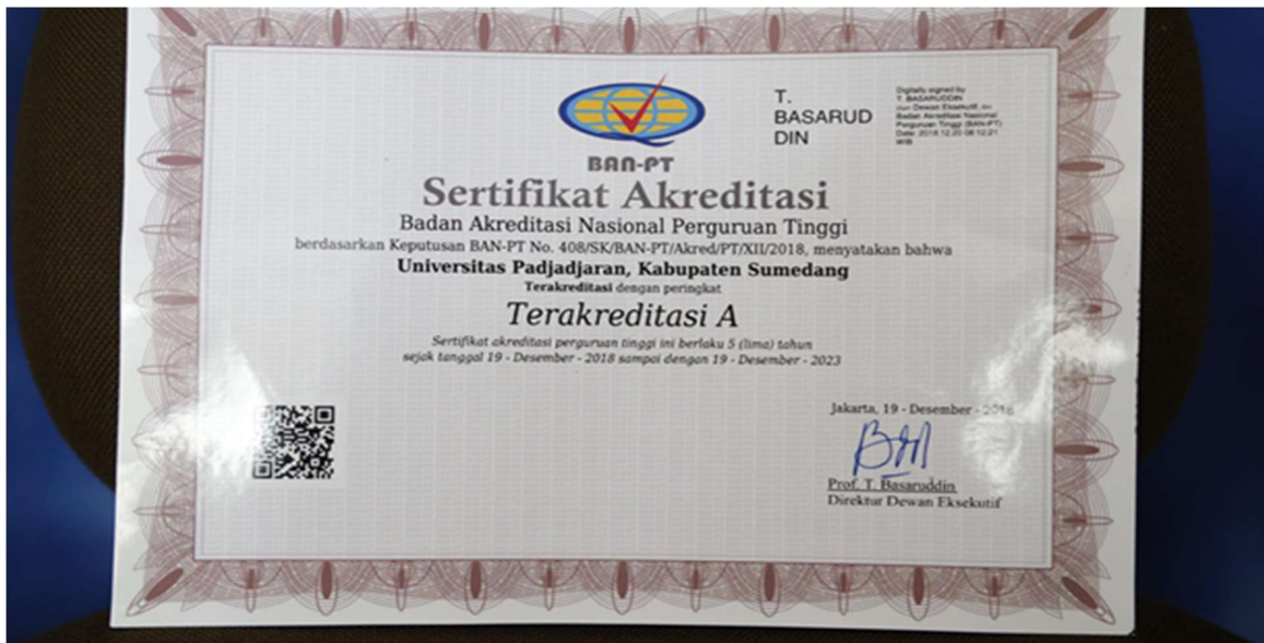
Sertifikat Akreditasi Unpad dari BANPT Tahun 2018

Berdasarkan Keputusan Badan Akreditasi Nasional Perguruan Tinggi (BAN PT) No. 408/SK/BAN-PT/Akred/PT/I/2018 tentang Nilai dan Peringkat Akreditasi Institusi Perguruan Tinggi Badan Akreditasi Nasional Perguruan Tinggi, yang ditetapkan pada 19 Desember 2018, Unpad mendapat peringkat A (sangat baik). Akreditasi ini berlaku selama 5 tahun sejak tanggal ditetapkan. (berlaku sampai dengan tahun 2023).